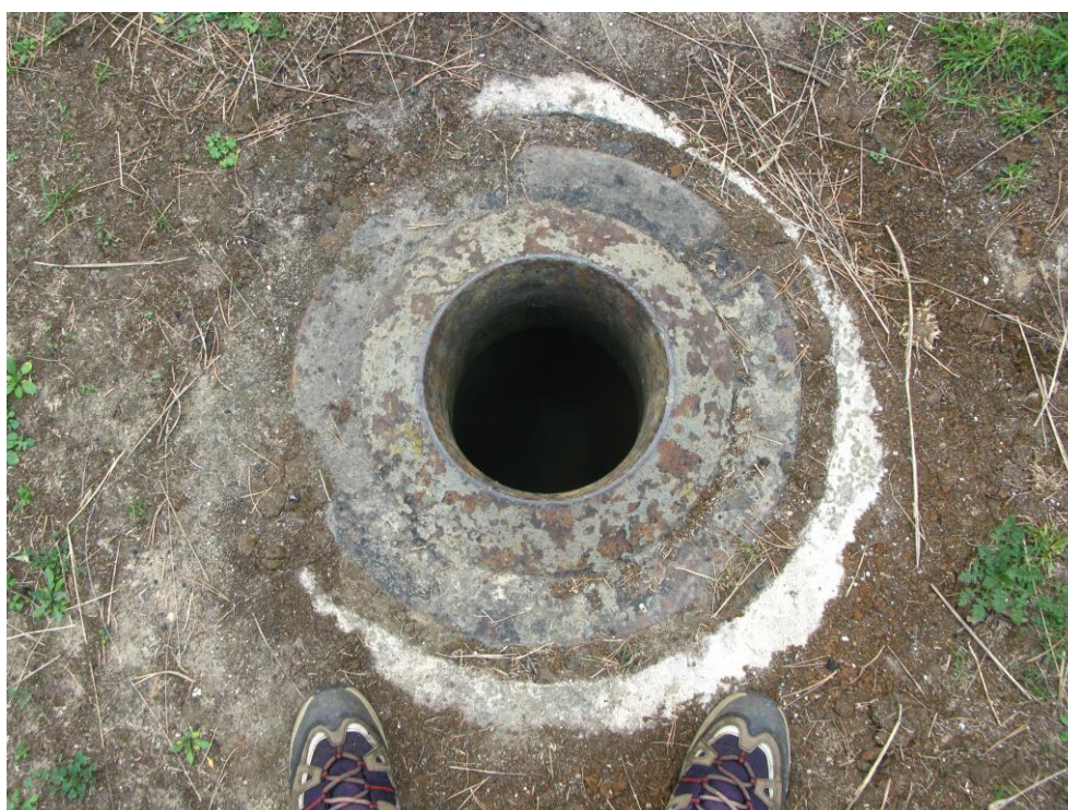
zdj. 5 – Kanał wentylacyjny w stropie obiektu.