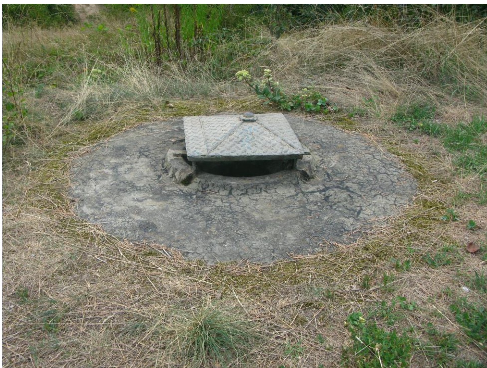
zdj. 5 – Kanał wentylacyjny częściowo przysłonięty.