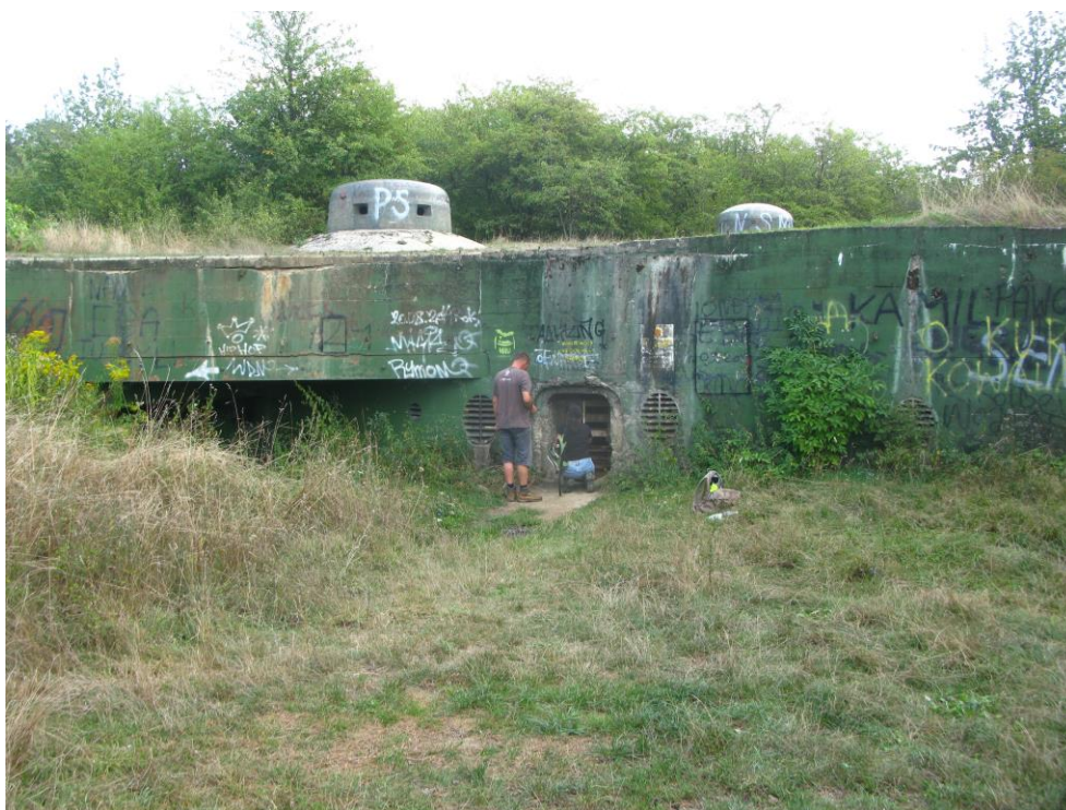
zdj. 3 – Widok na obiekt.