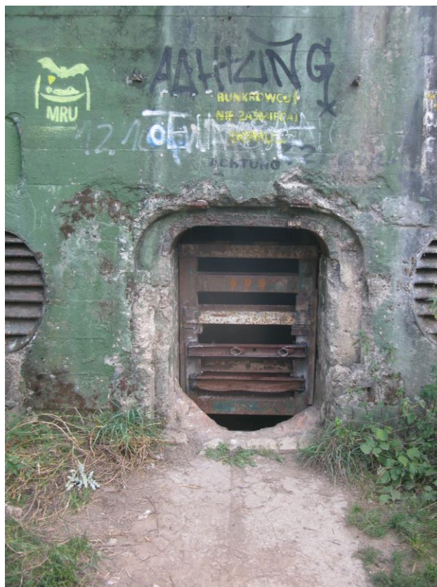
zdj. 2 – Widok na wejście i istniejącą kratę.