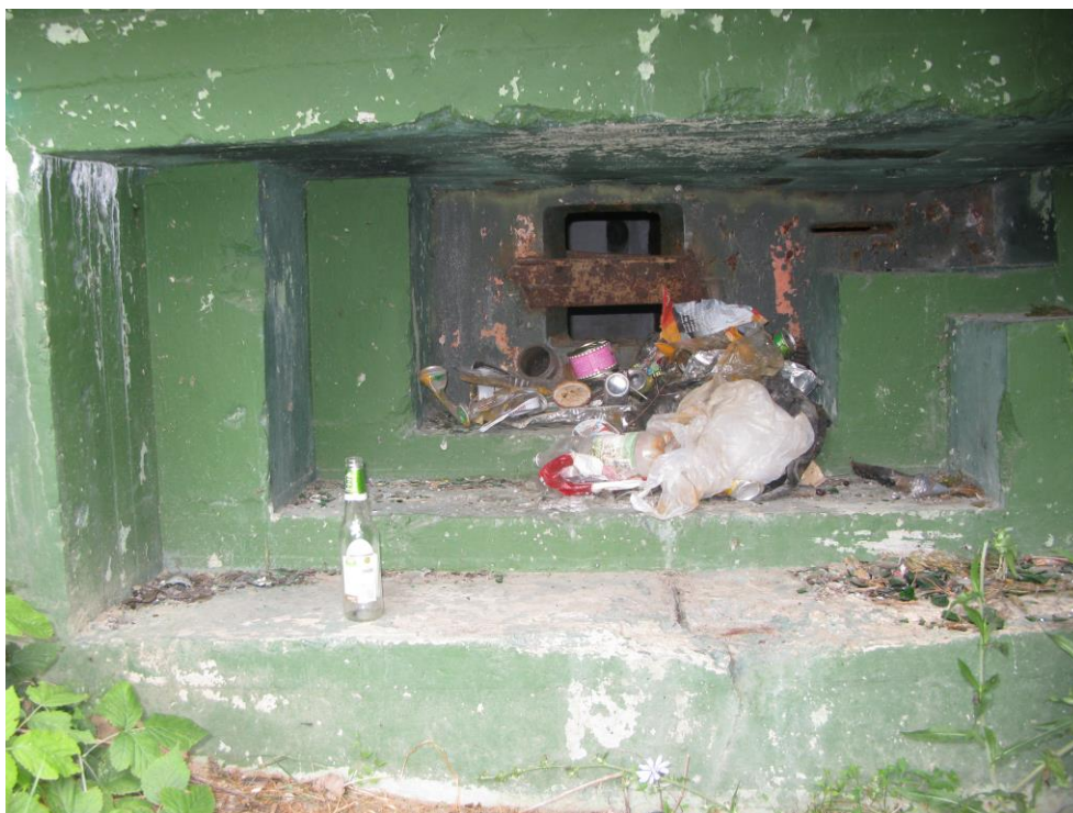
zdj. 4 – Okienko strzelnicze boczne.