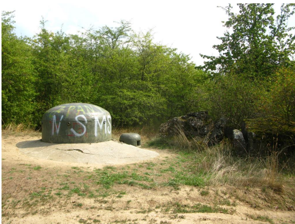
zdj. 6 – Widok na kopuły strzelnicze na dachu obiektu.